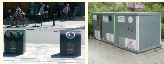
Unterflurcontainer (links) und Stellplatz (rechts) zur Entsorgung von Altglas in der Hanse- und Universitätsstadt Rostock

In der Hanse- und Universitätsstadt Rostock besteht ein gut ausgebautes Bring-System für Verpackungen aus Altglas. Im Stadtgebiet wurden in den vergangenen Jahren alle ca. 300 öffentlichen Standplätze mit lärmarmen Altglascontainern ausgestattet. Sie entsprechen einem sehr hohen Standard in Bezug auf Bedienfreundlichkeit, Lärminderung und Funktionsfähigkeit. Auf den vier Recyclinghöfen ist die Abgabe von Altglas aus Privathaushalten ebenfalls möglich.