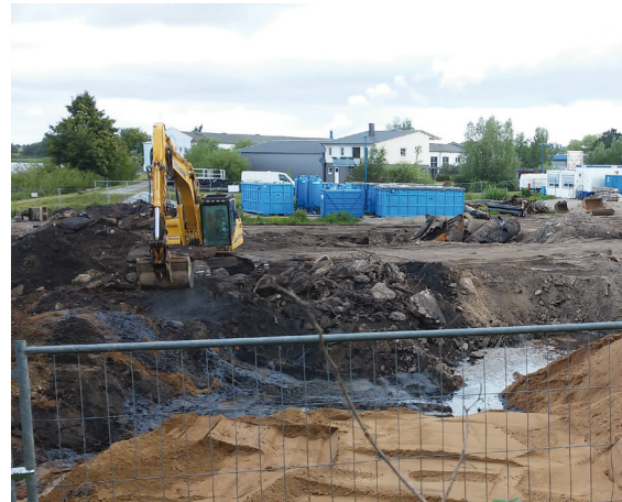
Sanierung der ehemaligen Bitumenverarbeitung in Rostock

Tel. +49 381 381-7341, Fax +49 381 381-7373 E-Mail: ulrike.huth@rostock.de http://www.rostock.de/Bodenschutzsymposium