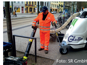
Einsatz des modernen Abfallsaugers

Das Amt für Umweltschutz setzt jährlich in der Saison gemeinsam mit der Stadtentsorgung Rostock GmbH verschiedene Maßnahmen u.a. zur Verbesserung der Sauberkeit auf öffentlichen Wegen und Plätzen um. Dazu gehört der Einsatz von Abfallsaugern als neue technische Geräte. Die Abfallsauger werden unterstützend für die Straßenreinigung in schwer erreichbaren Bereichen eingesetzt, insbesondere an Baumscheiben, in Bordsteinbereichen und an Einbauten u.a. zur Entsorgung von Hundekot.