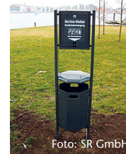
Hundetoilette mit Beutelspender