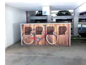
Fahrradbox im Parkhaus

Ein angemessener Witterungsschutz erhöht den Nutzungskomfort und die Akzeptanz der Anlage. Auch Fahrradboxen, -garagen oder -käfige können einem ausgewählten Mieter- oder Arbeitnehmerkreis für ein sicheres und geschütztes Abstellen bereitgestellt werden.