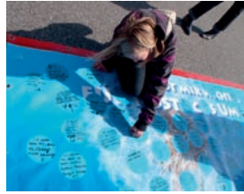
2010: Schülerprojekttage auf dem Betriebsgelände der RSAG