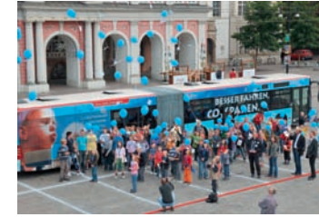
Europäische Mobilitätswoche 2009 auf dem Neuen Markt