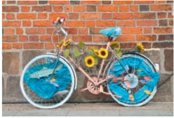
Europäische Mobilitätswoche 2010: Schulwettbewerb „Schrott-Rad-Kunst“