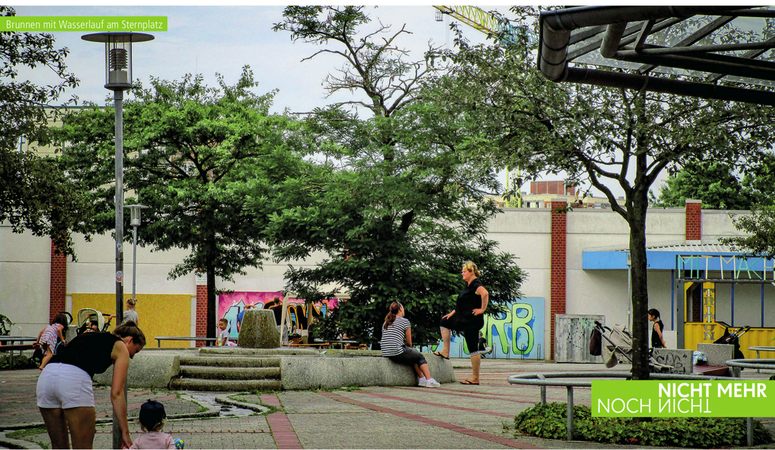
Brunnen mit Wasserlauf am Sternplatz