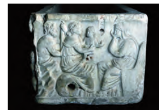
Adonis, Aphrodite und Persephone

Ein herausragendes Stück der Sammlung ist der Adonis Sarkophag