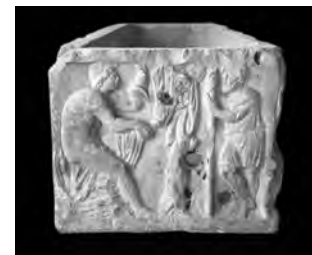
Adonis auf dem Weg in die Unterwelt