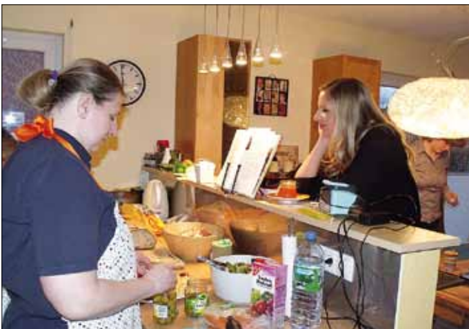
Gemeinsam Kochen oder Backen und mal etwas Neues ausprobieren steht immer donnerstags im Kalender der „Dierkower Frauen“ im SBZ Dierkow.

Hansestadt Rostock · Amt für Jugend und Soziales · Abt. Planung, Steuerung, Finanzen · St. - Georg - Str. 109 / Haus II · 18055 Rostock Tel.- Nr.: 0381 / 381 2558 · Fax: 0381 / 381 3510 · mail: Petra.Witt@Rostock.de