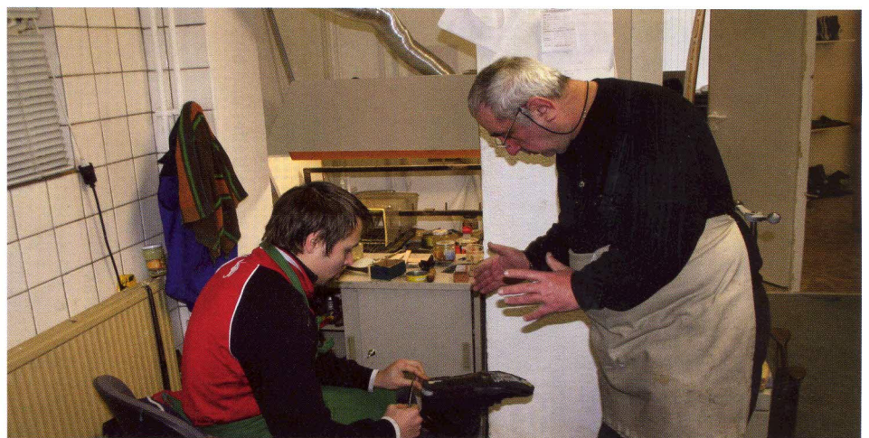
Der Meister zeigt, wie es geht

Der Aufbau des Ausbildungsplatzes für den Beruf Schuhmacher in der Schuh-Manufaktur-CHEKOO beinhaltet neben der Entstehung der konkreten Ausbildungsstelle, auch die spätere Möglichkeit, in Rostock als Schuhmacher arbeiten zu können.