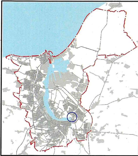
Lage im Stadtgebiet