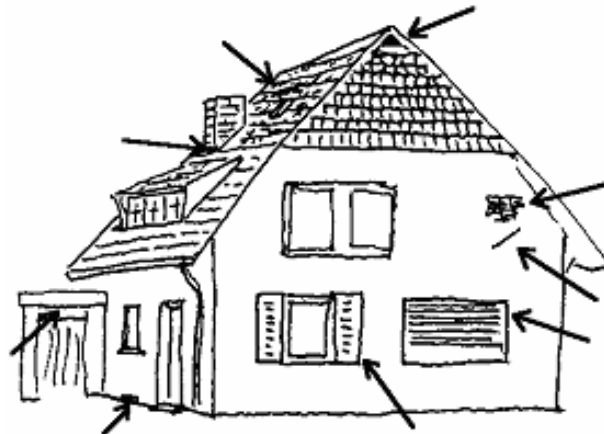
Einflug- und Versteckmöglichkeiten am Haus

Da die Tiere mehr oder weniger schlecht sehen, spielt die Ultraschallortung eine wichtige Rolle bei der Jagd. Die Tiere stoßen verschiedene Ultraschallimpulse aus, an denen man die Art identifizieren kann. Sie dienen zur Peilung der Beute, aber auch zur räumlichen Orientierung.