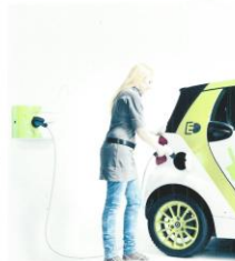
Werkstattsumstellung zum Start der UI EIMo