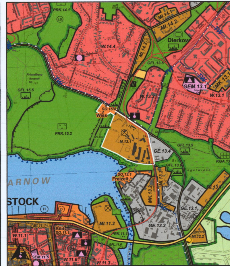
Informelle Darstellung des rechtswirksamen Flächennutzungsplans in der Fassung der Neubekanntmachung vom 21.11.2020 mit den Inhalten der 18. Änderung