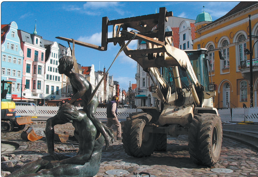
Kürzlich wurden die Bronze-Skulpturen am Universitätsplatz abmontiert. Voraussichtlich im Mai soll der Brunnen wieder sprudeln.