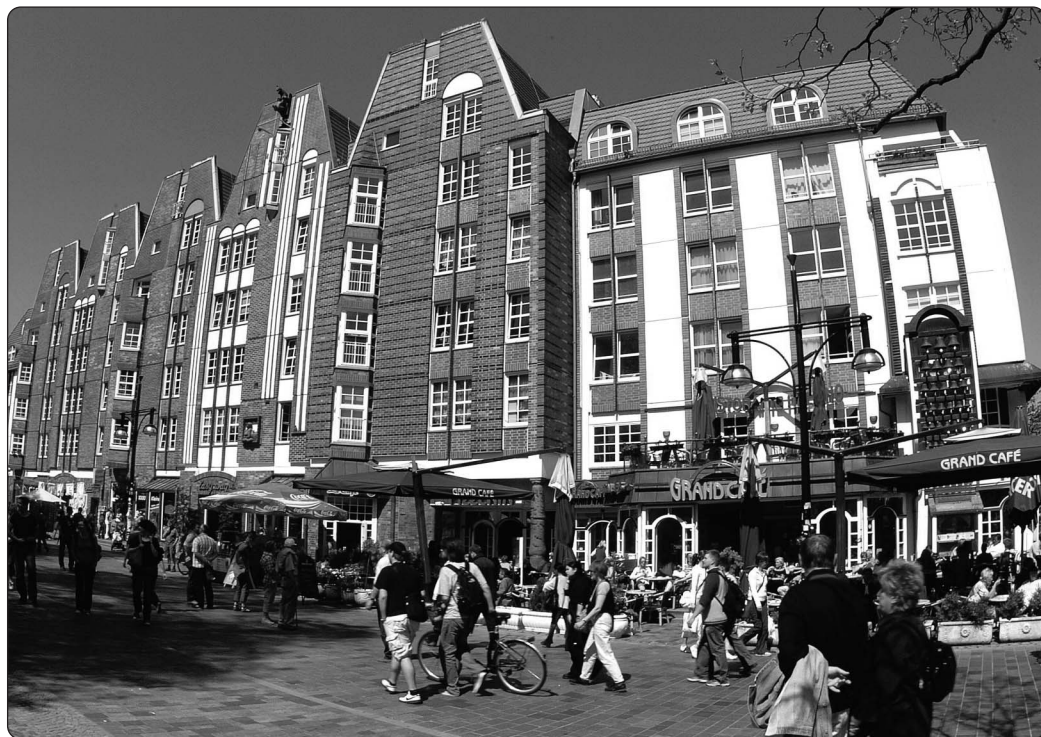
Rostock wurde als Studienort für eine neue bundesweite Gesundheitsanalyse des Robert-Koch-Instituts ausgewählt.

Das Robert Koch-Institut ist ein Bundesinstitut im Geschäftsbereich des Bundesministeriums für Gesundheit. Weitere Informationen unter www.rki.de/degs .