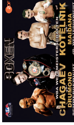
WM-Boxkampf - Stadhalle Rostock