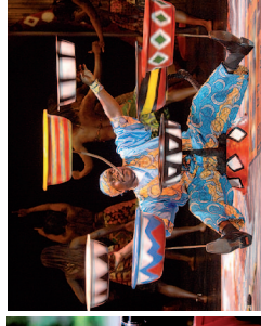
Afrika, Afrika! - Stadhalle Rostock