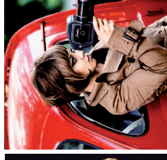
Annett Louisan - Stadhalle Rostock