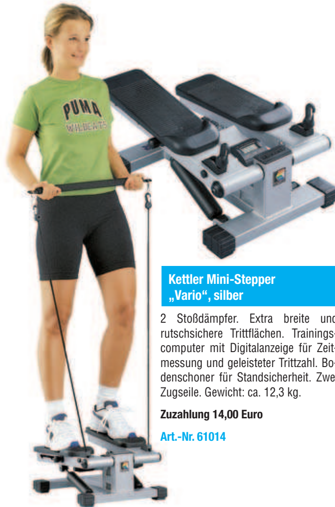
Kettler Mini-Stepper „Vario“, silber

2 Stoßdämpfer. Extra breite und rutschsichere Trittlflächen. Trainingscomputer mit Digitalanzeige für Zeitmessung und geleisteter Trittzahl. Bodenschoner für Standsicherheit. Zwei Zugseile. Gewicht: ca. 12,3 kg.