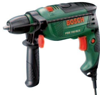
Bosch Schlagbohrmaschine PSB 750 RCE im Koffer

Jetzt einen neuen Abonnenten für die OZ gewinnen und ein Dankeschön erhalten. Sie müssen selbst nicht Abonnent sein, um einen neuen Leser zu werben.