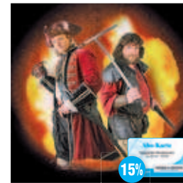
Piraten Open Air Grevesmühlen