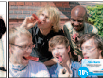
Les Bummms Boys - Zirkus Fantasia Stadthafen Rostock