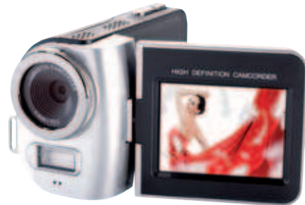
Aiptek Full-HD-Camcorder AHD T8 Pro, silber

Telefon 01802-381 365 • Fax 01802-381 368 • E-Mail kundenservice@ostsee-zeitung.de