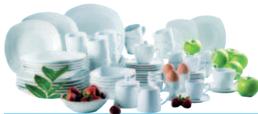
Domestic Kombiservice „Hannah“ 63-tlg.

6 Kaffeetassen. 6 Untertassen. 6 Dessertteller. 6 Teller tief. 6 Teller flach. 6 Kaffeebecher. 6 Espressotassen. 6 Espresso-untertassen. 6 Eierbecher. 6 Schüsseln. 1 Zuckerdose. 1 Milchgießer. 1 Platte. Material: Porzellan. Spülmaschinen und Mikrowellen geeignet.