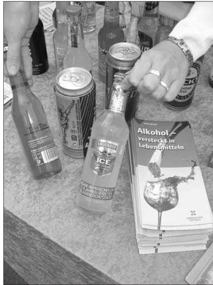
Alkoholsucht kann Leben zerstören.

Dalwitzhofer Weg 1a (Hof), Nähe Wasserturm, Voranmeldung für Gruppen erbeten, Tel. 0381 4590807