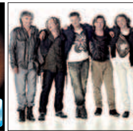
PUR IGA-Parkbühne Rostock