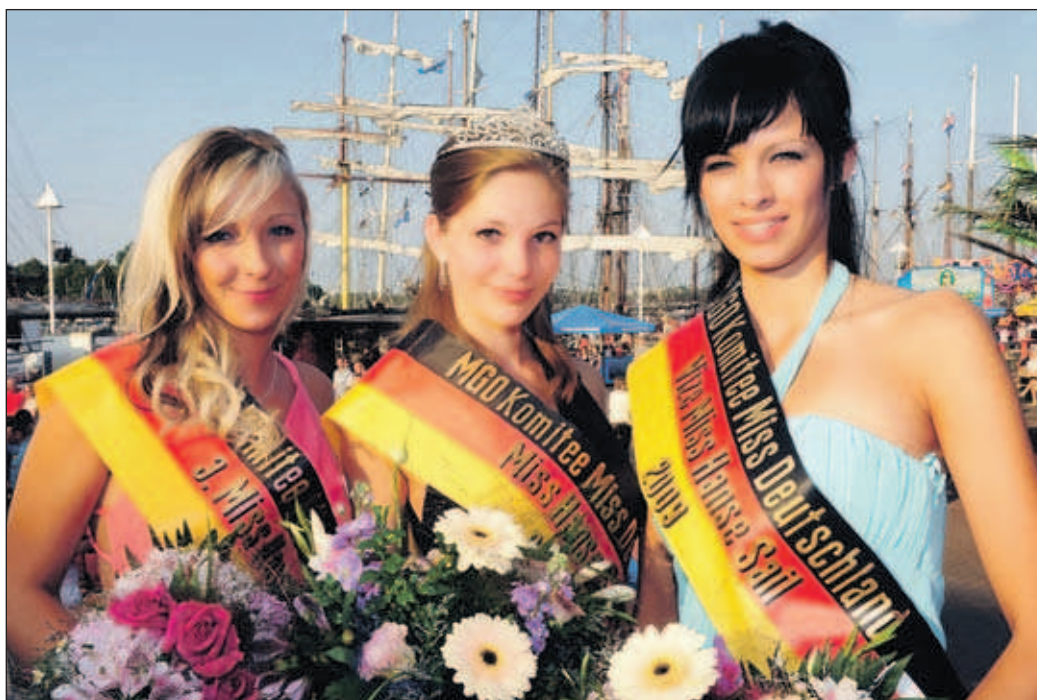
Die drei Schönsten 2009.