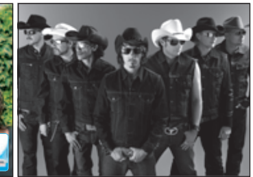
The Boss Hoss Rugardbühne Rügen

* Vorverkauf bis 3 Tage vor dem Veranstaltungstag und nur in den OZ-Service-Centern. Änderungen und Irrtümer vorbehalten. Für die Veranstaltung ist die OSTSEE-ZEITUNG nur Vermittler. Für verlorene Eintrittskarten erstattet der jeweilige Veranstalter keinen Ersatz.