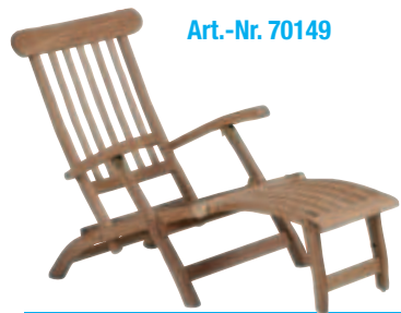
Zebra Teak-Deckchair „Yachtclub“

Rückenteil vielfach verstellbar. Scharniere aus Messing. Maße: ca. 60 x 170 x 98/37 cm (BxTxH/SH)