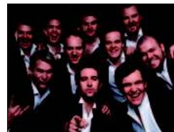
The Ten Tenors Stadthalle Rostock