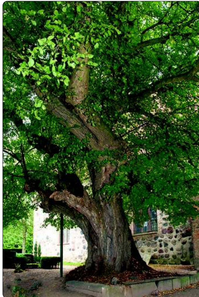
Der Tag des Baumes wird am 25. April weltweit begangen.

Eine Aktion mit Kindern zum Tag des Baumes wird im Herbst im Botanischen Garten stattfinden, da dann die Früchte der Elsbeere besonders gut zur Geltung kommen. Bereits am 1. Mai findet um 14.30 Uhr unter dem Motto „Die Elsbeere und ihre Verwandten“ eine Führung im Botanischen Garten statt. Alle Interessierten sind dazu herzlich eingeladen.