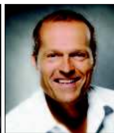
Joja Wendt Stadthalle Rostock, Saal 2