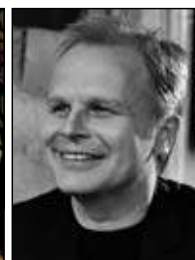
Herbert Grönemeyer IGA-Parkbühne Rostock

* Vorverkauf bis 3 Tage vor dem Veranstaltungstag und nur in den OZ-Service-Centern. Änderungen und Irrtümer vorbehalten. Für die Veranstaltung ist die OSTSEE-ZEITUNG nur Vermittler. Für verlorene Eintrittskarten erstattet der jeweilige Veranstalter keinen Ersatz.