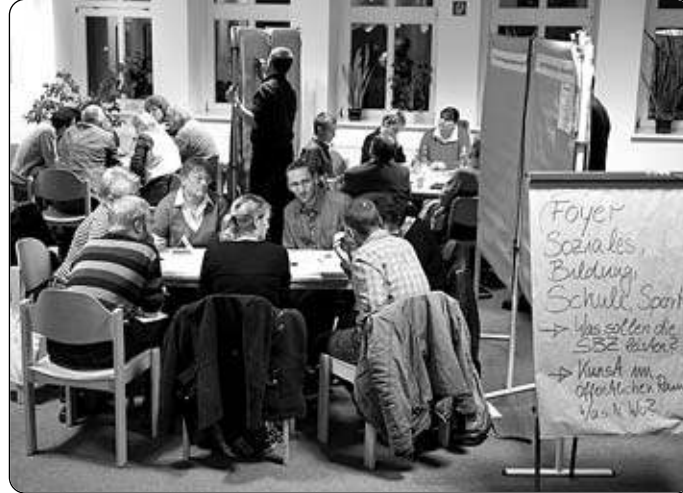
Im regen Meinungsaustausch.

Die Ausstellung zum Bürgerforum kann von Montag bis Freitag von 9.00 bis 12.00 Uhr, Dienstag von 13.30 bis 17.30 Uhr und Donnerstag von 13.30 bis 16.00 Uhr im Ortsamt Nordost in der J.-Nehru-Str. 33 besichtigt werden. Eine gekürzte Fassung der Ausstellung ist im Internet unter www.rostock.de/Stadtentwicklung zu finden.