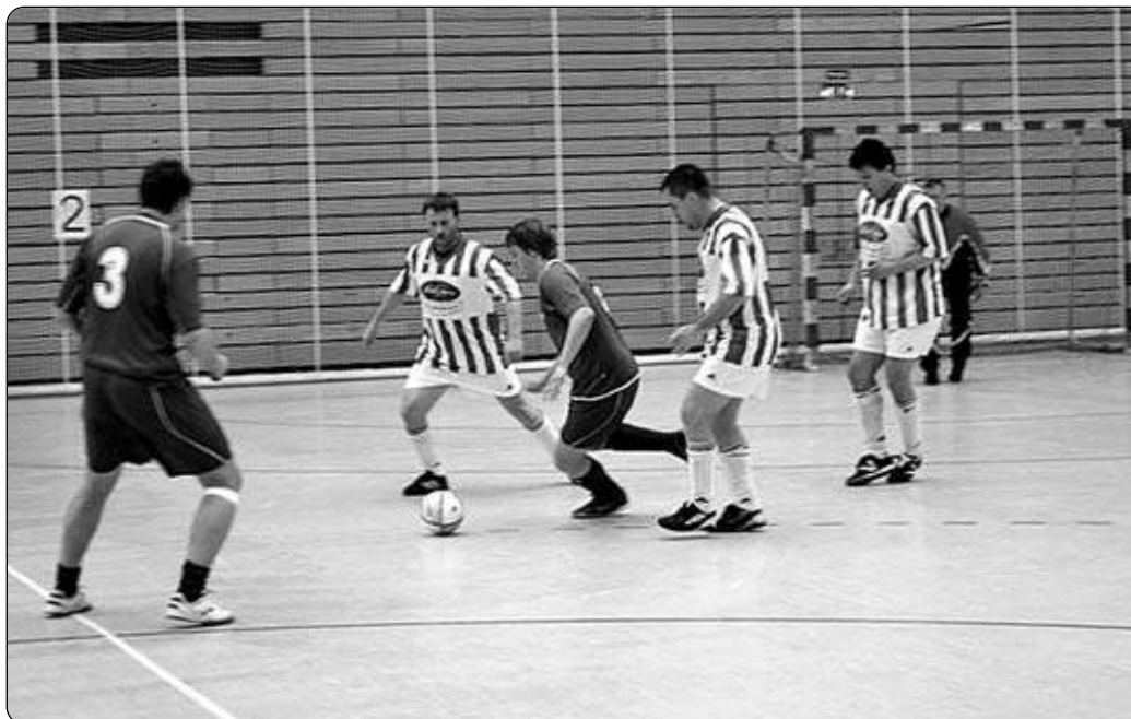
Szene aus Mecklenburg (grün-weiß) - Tschechien 0:2 (Berlin 2010)

Weitere Informationen sind auf der Homepage www.euro2011-rostock.de zu finden.