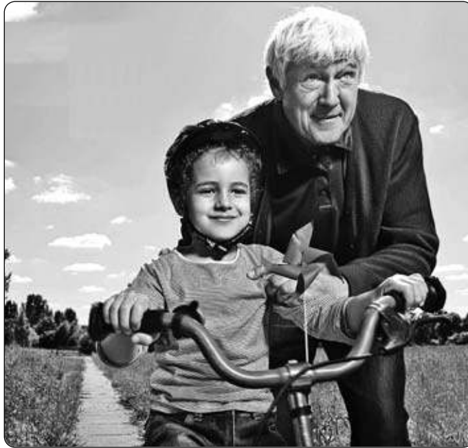
Statistisches Bundes- bzw. Landesamt