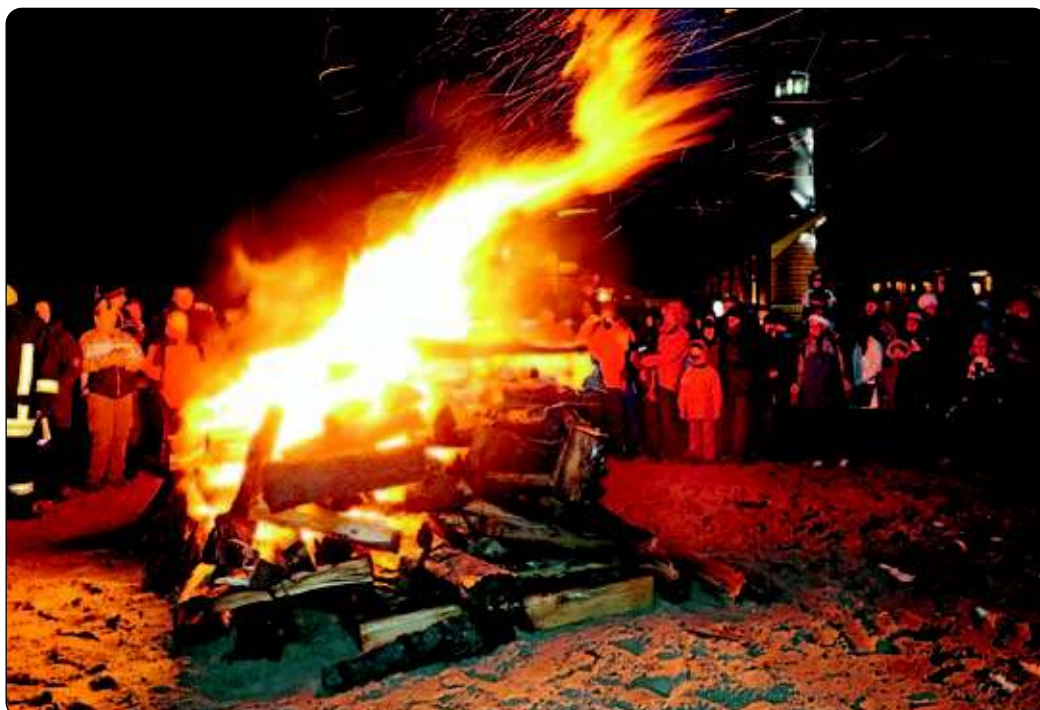
Osterfeuer am Strand von Warnemünde.

Anlässlich des Europäischen Aktionstages zur Gleichstellung von Menschen mit Behinderung finden am 5. Mai zahlreiche Aktionen statt. OB Roland Methling eröffnet im Rathaus eine Fotoausstellung „normlos“. Zu einer Diskussion „Vergiss mich nicht“ sind alle Interessenten herzlich ins Rathaus eingeladen. Auf dem Universitätsplatz ist eine Demonstration geplant. Hier präsentieren sich auch Vereine, Verbände, Selbsthilfegruppen und Einrichtungen mit einem Markt. Eine Autogrammstunde des FC Hansa ist ebenfalls geplant.