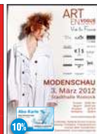
ART EN Vogue Stadthalle Rostock