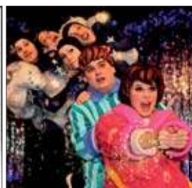
Lauras Stern Stadthalle Rostock