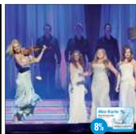
Celtic Woman Stadthalle Rostock

* Vorverkauf bis 3 Tage vor dem Veranstaltungstag und nur in den OZ-Service-Centern. Änderungen und Irrtümer vorbehalten. Für die Veranstaltung ist die OSTSEE-ZEITUNG nur Vermittler. Für verlorene Eintrittskarten erstattet der jeweilige Veranstalter keinen Ersatz.