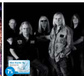
Uriah Heep & Nazareth IGA-Parkbühne Rostock