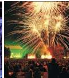
Prebberede Klassik open air Schlossgarten Prebberede