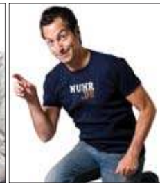
Dieter Nuhr Stadthalle Rostock