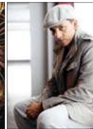
Xavier Naidoo & Quartett IFA Sommergarten Berlin