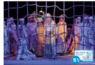
Nabucco Marktplatz Ribnitz-Damgarten