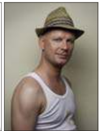
Rüdiger Hoffmann Stadthalle Rostock

* Vorverkauf bis 3 Tage vor dem Veranstaltungstag und nur in den OZ-Service-Centern. Änderungen und Irrtümer vorbehalten. Für die Veranstaltung ist die OSTSEE-ZEITUNG nur Vermittler. Für verlorene Eintrittskarten erstattet der jeweilige Veranstalter keinen Ersatz.