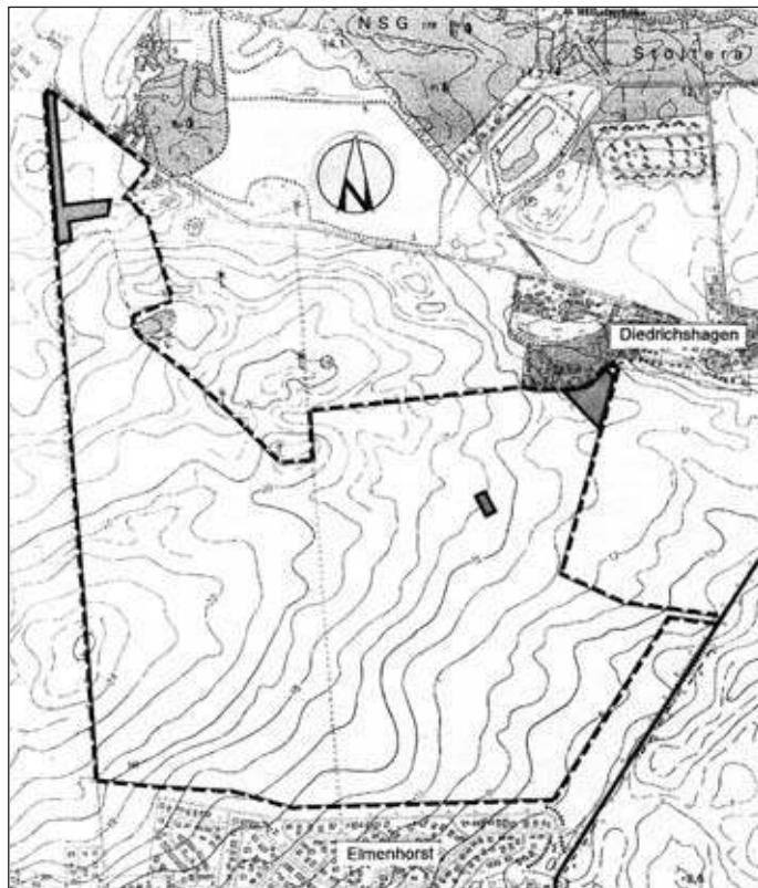
Übersichtsplan zur öffentlichen Bekanntmachung des Beschlusses über die 2. Änderung des Bebauungsplanes Nr. 01.Golf.145 „Golfplatz Diedrichshagen/Elmenhorst“

Ralph Müller Leiter des Amtes für Stadtentwicklung, Stadtplanung und Wirtschaft