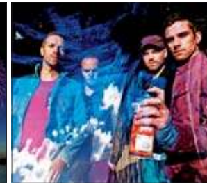
Coldplay Red Bull Arena Leipzig