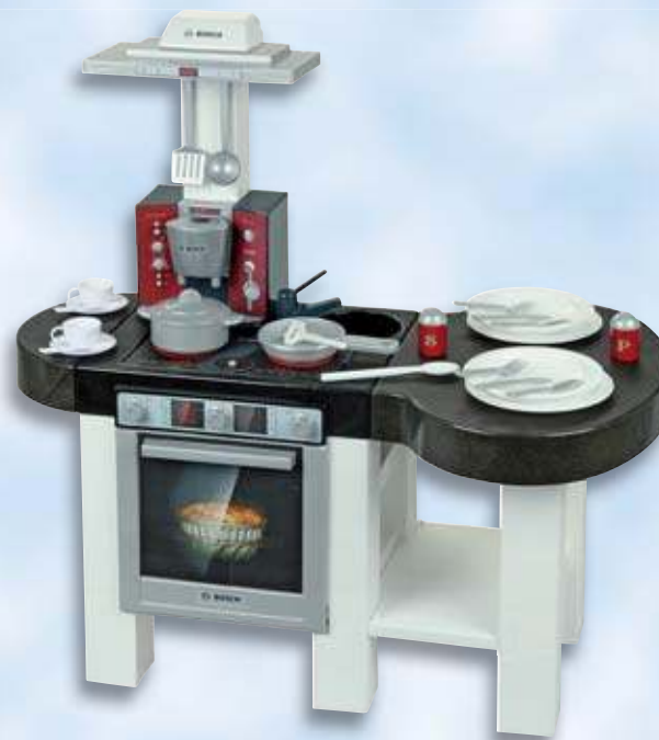
Bosch elektron. Spielküche „Cool“ mit viel Zubehör

Beidseitig bespielbar. Elektronische Kochgeräusch. Kaffeemaschine mit Soundfunktion. Mit Ofen, Spüle und Spülmaschine. Mit ovalem Spiel- und Esstisch. Batterien: 4x LR03, 1,5V, AAA (nicht enthalten). Höhe: ca. 95 cm.