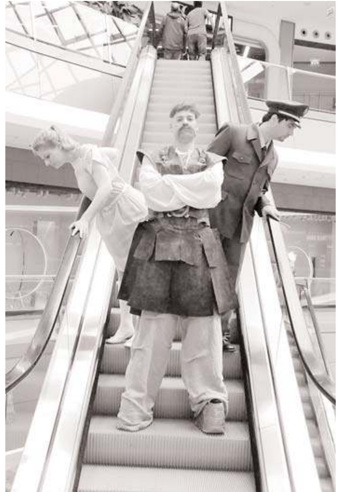
Hier proben die Schauspieler den Spuk auf der Rolltreppe.