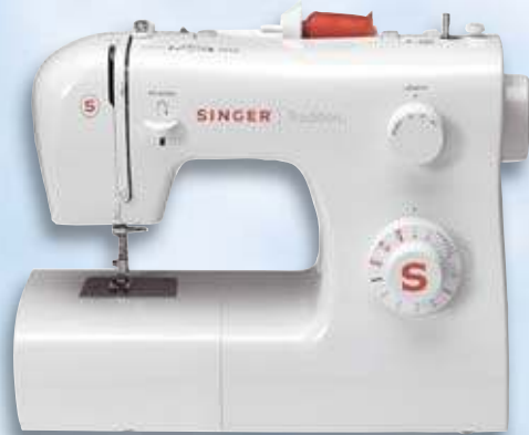
Singer Nähmaschine „Tradition“ 2250

10 Nähprogramme inklusive Knopfloch. 3 Dekostiche: Zum Verzieren Ihrer Näh-Projekte. Automatisches Knopfloch in 4 Schritten. Rückwärtsnähen. Freiarm: Für Rundgeschlossenes (Ärmel, Hosenbeine usw.). Aufspulautomatik. TÜV/GS und CE geprüft, Grüner Punkt. Maße: ca. 37 x 17 x 32 cm (LxBxH). Gewicht: ca. 6 kg. Zuzahlung: 39,00 €