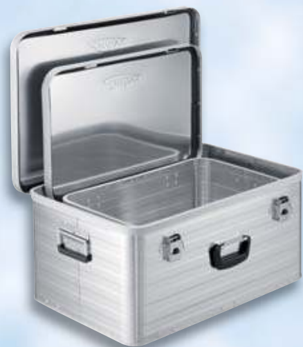
Enders Alu-Boxen 2-er Set 29+63 I

Jetzt einen neuen Abonnenten gewinnen und ein Dankeschön erhalten. Sie müssen selbst nicht Abonnent sein, um einen neuen Leser zu werben.