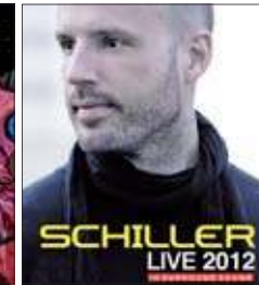
Schiller Stadthalle Rostock