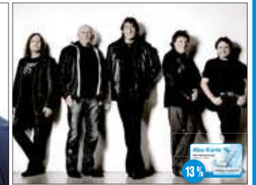
Ostrock Stadthalle Rostock

* Vorverkauf bis 3 Tage vor dem Veranstaltungstag und nur in den OZ-Service-Centern. Änderungen und Irrtümer vorbehalten. Für die Veranstaltung ist die OSTSEE-ZEITUNG nur Vermittler. Für verlorene Eintrittskarten erstattet der jeweilige Veranstalter keinen Ersatz.