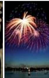
Pyrogames IGA-Parkbühne Rostock