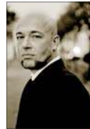
Unheilig IGA-Parkbühne Rostock