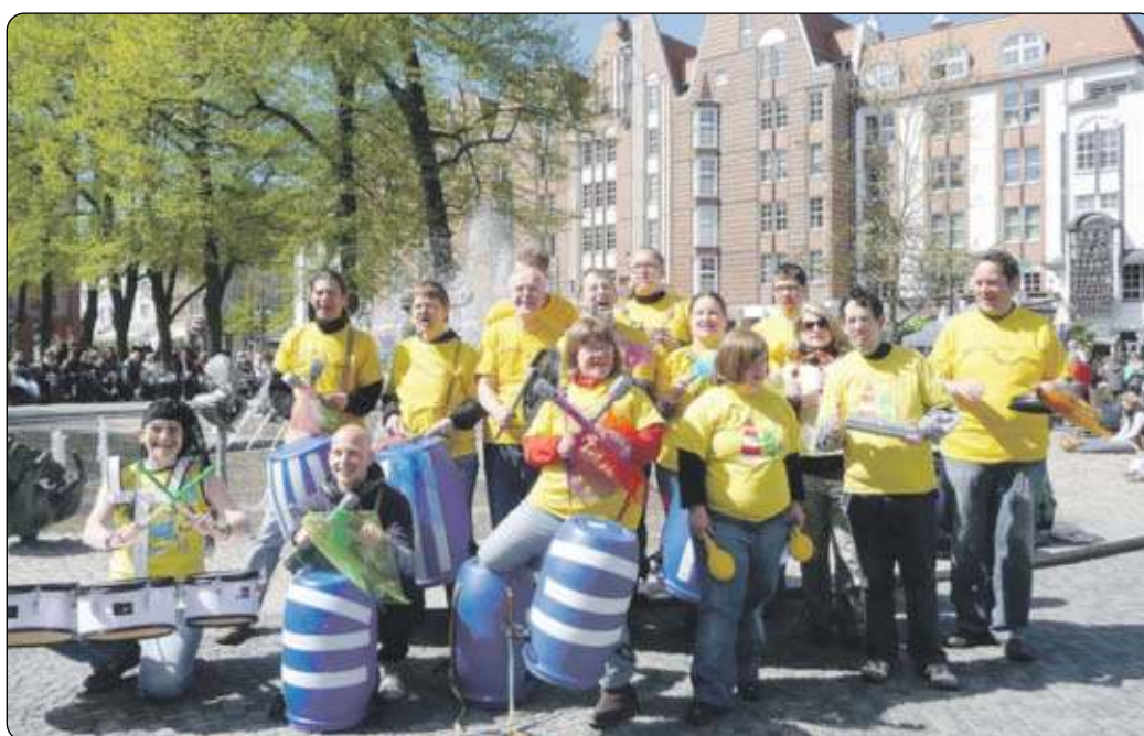
Gemeinsame Aktionen auf dem Universitätsplatz anlässlich eines Aktionstages, hier die Trommelgruppe des Integrativen Treffs.

Unter dem Motto „Jede Barriere ist eine zuviel“ finden am 3. Mai anlässlich des Europäischen Aktionstages zur Gleichstellung von Menschen mit Behinderung im Rathaus, auf dem Universitätsplatz, dem Neuen Markt und im Stadthafen zahlreiche Veranstaltungen statt. „Wir wollen auf die Situation von Menschen mit Behinderung aufmerksam machen und dafür eintreten, dass alle Menschen gleichberechtigt an der Gesellschaft teilhaben können“, unterstreicht Rostocks Behindertenbeauftragte Petra Kröger. 31 Vereine, Verbände und Selbsthilfegruppen der Behindertenhilfe sowie Institutionen stellen sich am 3. Mai im Rathaus und auf dem Universitätsplatz vor. Am Vormittag lädt die SELBSTHILFE MV e.V. zu einem öffentlichen politischen Diskussionsforum zum Thema „Meine Stimme zählt“ ins Rathaus-Foyer ein. Rund um den Universitätsplatz findet ein Bühnenprogramm mit Autogrammstunde des FC Hansa statt. Mit der Kampagne „END POLIO NOW“ wird auf dem Neuen Markt über den Kampf gegen Kinderlähmung aufgeklärt. Im Stadthafen bietet der Circus Fantasia mehrere Aktionen an.