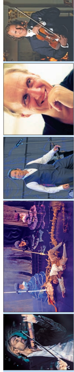
David Garrett Schlossgarten Ludwigslust, Die Zauberflöte - Klassik Open Air Münstergelände Bachgarten Bad Doberan, Roland Kaiser Rugard-Bühne Bergen auf Rügen, Herman van Veen Heiligen-Geist-Kirche Rostock, André Rieu und Orchester Stadthalle Rostock

Ein Angebot der Ostsee-Zeitung GmbH & Co. KG, Richard-Wagner-Str. 1a, 18055 Rostock, HR A 438. Für die Veranstaltungen ist die OSTSEE-ZEITUNG nur Vermittler. Änderungen und Irrtümer vorbehalten.