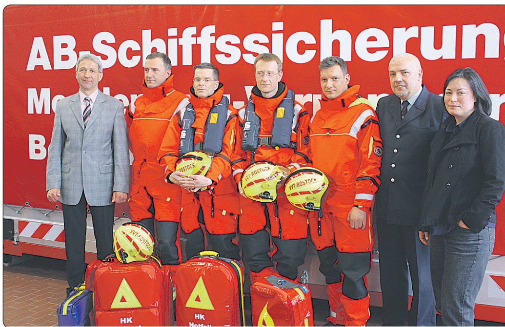
Mitglieder des Verletztenversorgungsteams (Bildmitte) in Dienstausrüstung sind für den Einsatz bereit.