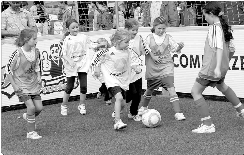
Auch der Spaß darf natürlich nicht zu kurz kommen. Gekickt wird in vier Altersgruppen.