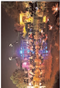
LichtKlangNacht IGA-Parkbühne Rostock