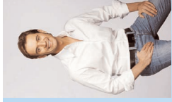
Das Fest der Feste Stadthalle Rostock