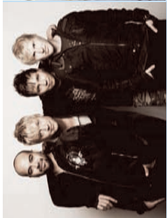
Sunrise Avenue IGA-Parkbühne Rostock