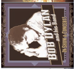
Bob Dylan Stadthalle Rostock