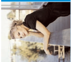
Ina Müller & Band Stadthalle Rostock