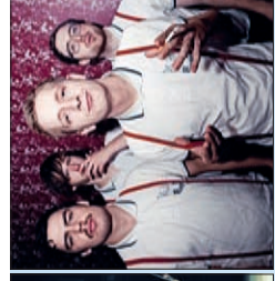
Kraftklub Stadthalle Rostock