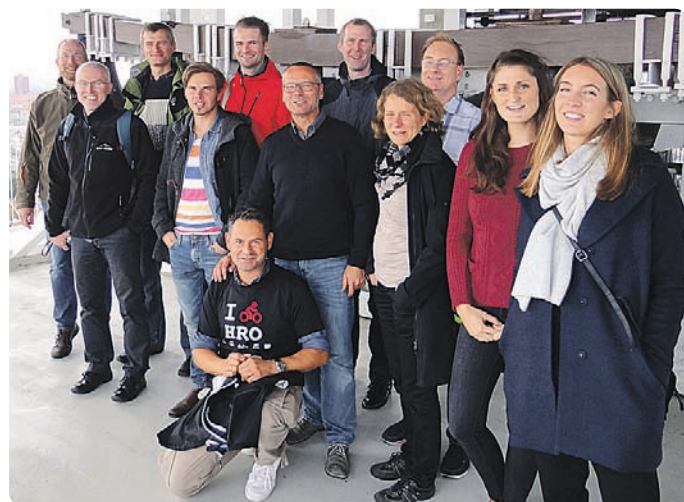
Teilnehmer des internationalen Radverkehrs-Workshops auf dem Rathaus-turm in Aarhus