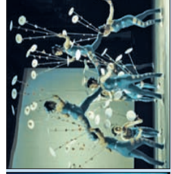
Chinesischer Nationalcircus Stadthalle Rostock