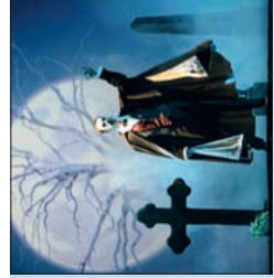
Das Phantom der Oper Vogelsanghalle Stralsund