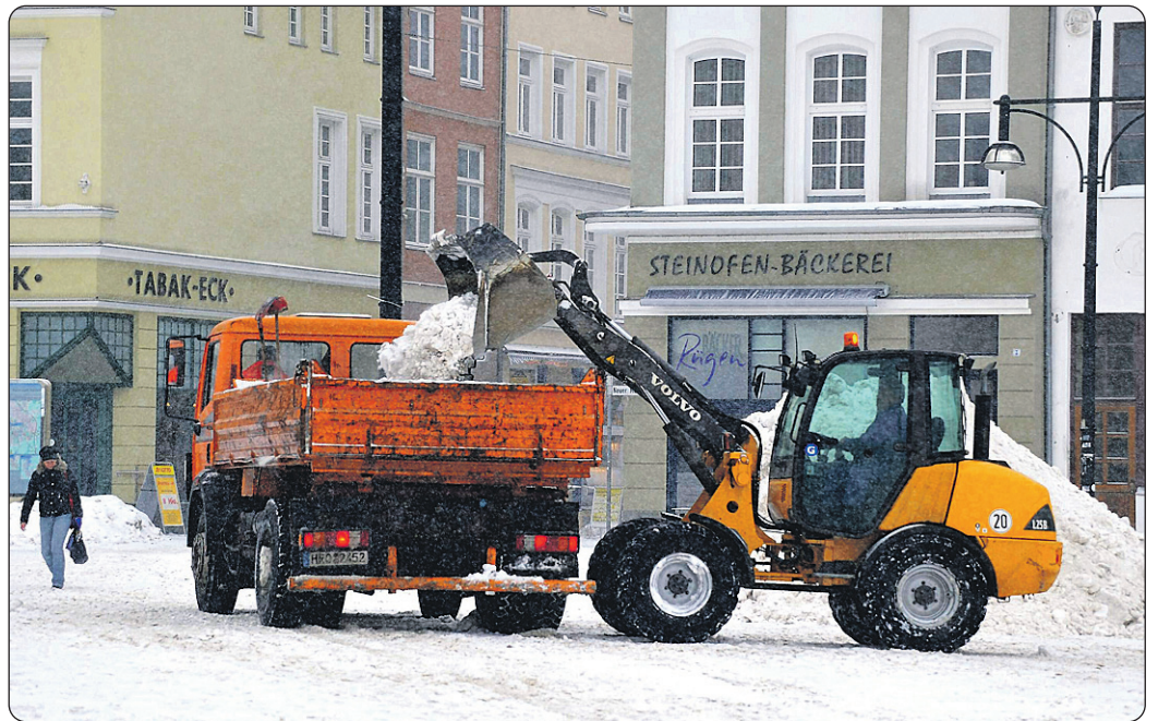
Schneeräum- und Streupflicht besteht von 7 bis 20 Uhr sowohl an Werk- als auch an Sonn- und Feiertagen.

Alle Regelungen zum Winterdienst sind in der Straßenreinigungssatzung der Hansestadt Rostock festgeschrieben, die im Internet unter www.rostock.de/umweltamt nachzulesen ist. Hinweise, Kritik oder Beschwerden können über das Internetportal „Klarschiff-Rostock“ angebracht werden. Die Meldungen werden an die zuständigen Fachämter weitergeleitet und entsprechend bearbeitet.