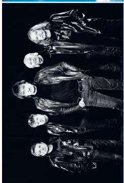
Puhlys Stadthalle Rostock