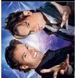
Eirlich Brothers Stadthalle Rostock