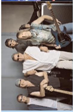
Deep Purple Stadthalle Rostock