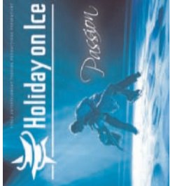
Holiday on Ice Stadthalle Rostock