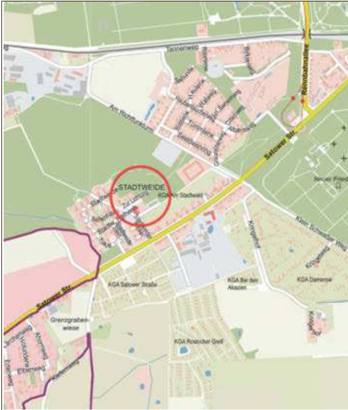
Anlage Straßenbenennung Zur Lichtung