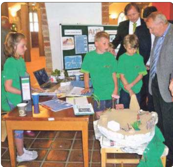
Eindrücke einer zurückliegenden Auszeichnungsveranstaltung.

Für Rückfragen steht Ihnen Swea Plavius unter Tel. 381-1163 zur Verfügung.