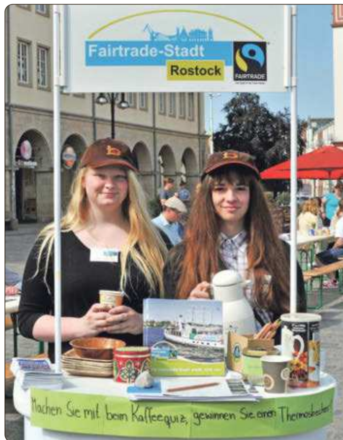
Mit einer Fairtrade-Kaffeepause wurde kürzlich für Fairen Handel gewonnen. Unterstützt wurde die Aktion von zahlreichen Rostocker Unternehmen sowie Schülern und Studierenden. Rostock trägt seit 2012 den Titel „Fairtrade-Stadt“.