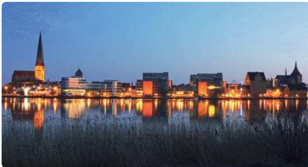
1. Platz: Rostock bei Nacht von Andreas Lau