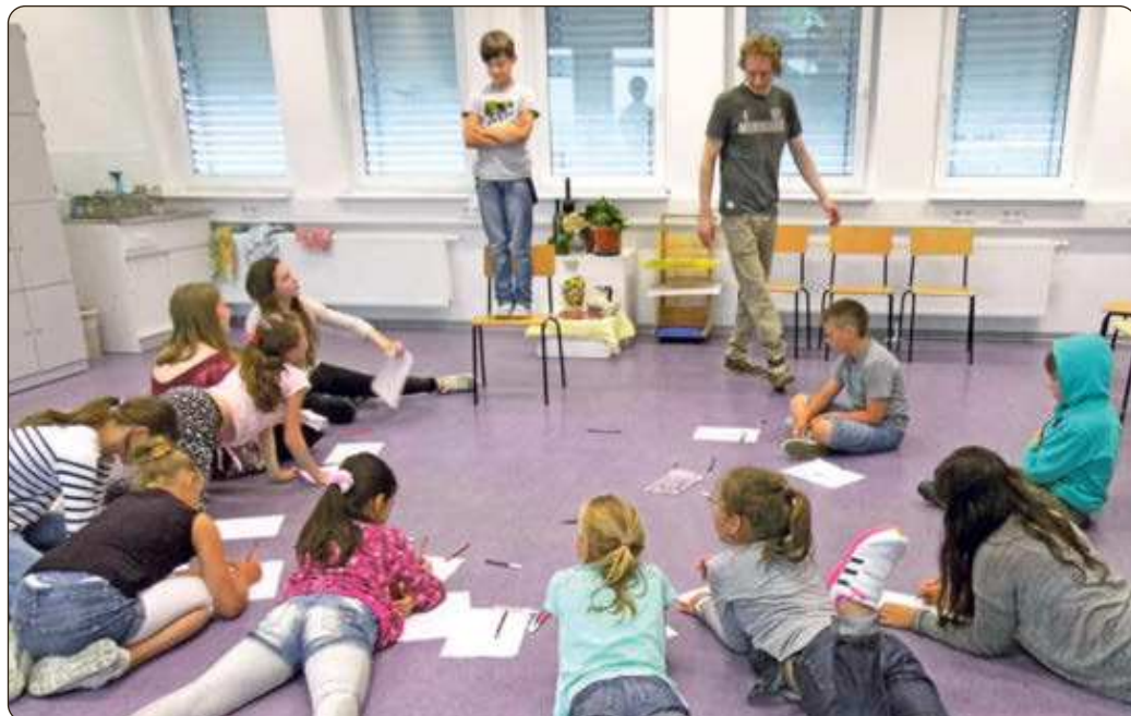
Körperstudie, Zeichnen eines Modells

Weitere Projektwochen finden unter anderem in Zusammenarbeit mit dem Stadtteil- und Begegnungszentrum Dierkow und den Rostock Griffins statt.