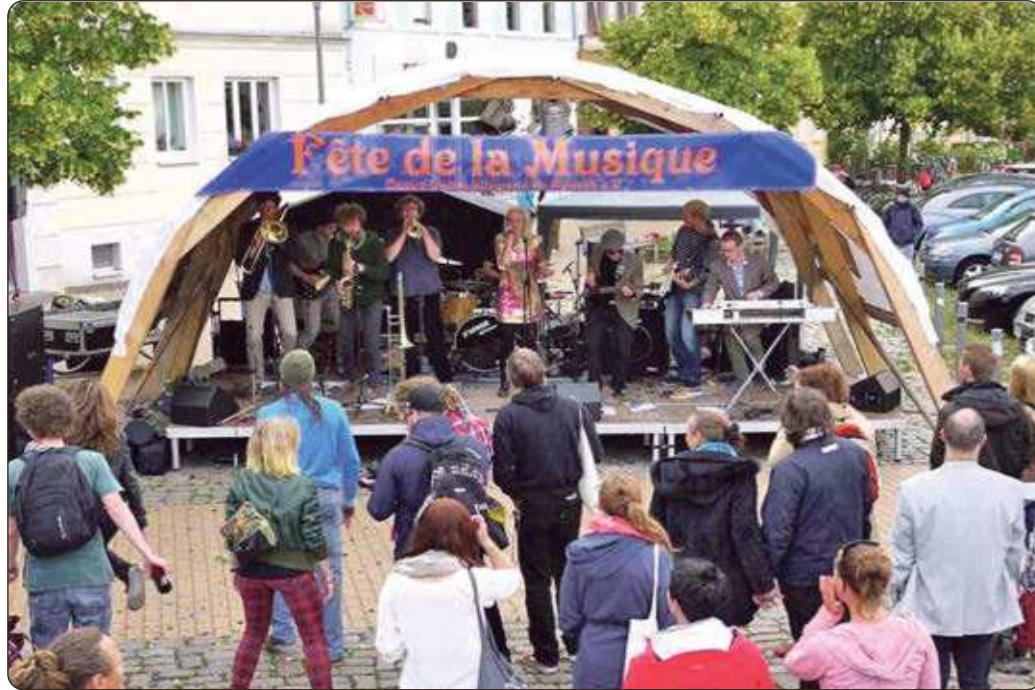
Das ursprünglich aus Frankreich stammende Straßenmusikfest, hat bereits in den vergangenen Jahren das Publikum begeistert.

Die Künstler im Überblick: Sippel, Zen Bison, Tarik & The Vaines, Mates, Misziplin, Son Of Machine, Unpainted Blue, Diego Hagen, Müller-Schulz, Aekjubohra, ALIYIAS, Eric Mark, Paratax, Mary Go Round, GermsX, Rock Kombinat Nord,