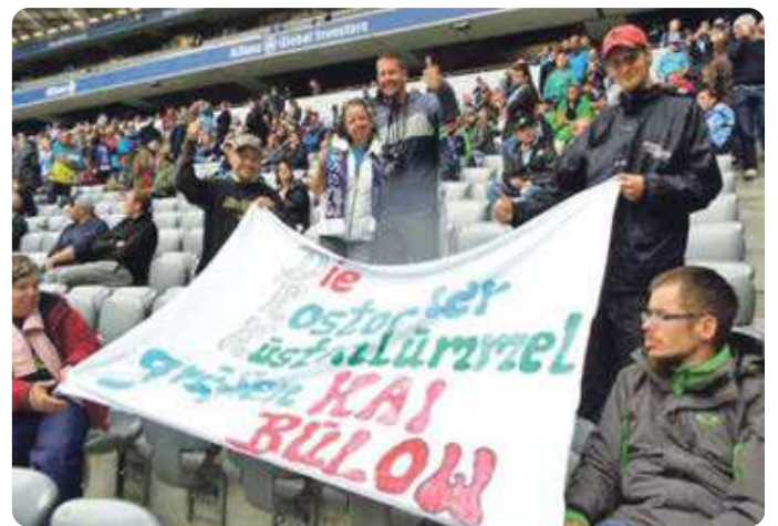
2. Platz: Kai Bülow Fanclub im Münchner Stadion von Sybille Pavel