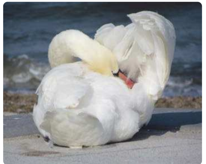
3. Platz: Schwaan von Petra Metsch