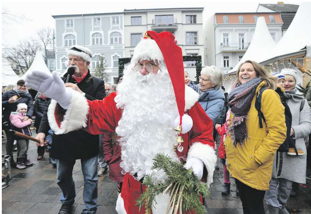
Am 24. Dezember wird dann der Weihnachtsmann am Alten Strom wieder Geschenke verteilen.

ten. Das Warnemünder Turmleuchten wird das 125. Jubiläum des markanten Leuchtfeuers mit einer spektakulären Show aus Licht, Feuerwerk, Lasern und Musik einläuten. Beginn ist 15 Uhr. Die große Finalshow startet um 18 Uhr.