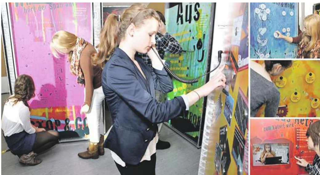
Wanderausstellung ECHT KRASS

Die vom ASB Familienzentrum organisierte Ausstellung des PETZE-Institutes „ECHT KRASS“ bietet den Jugendlichen die Möglichkeit der Auseinandersetzung mit dem Thema „sexuelle Grenzverletzungen“ zu den