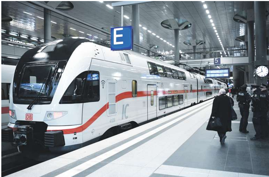
Frisch lackiert im weißen IC-Design, so wird der neue Zug am 7. März um 10.33 Uhr seine Premiere-fahrt nach Berlin antreten.

Die Deutsche Bahn hat ihr Fernverkehrsangebot zum letzten Fahrplanwechsel ausgebaut: Seit Mitte Dezember 2019 führt eine neue Intercity-Linie von Rostock über Berlin nach Dresden und zurück. Damit sind auch Oranienburg, Doberlug-Kirchhain, Elsterwerda und Dresden schnell und komfortabel mit Fernzügen erreichbar. Das neue Angebot bedeutet attraktivere Reisezeiten: Zum Beispiel von Rostock nach Berlin in knapp zwei Stunden. Oder von Rostock nach Dresden in weniger als viereinhalb Stunden. Rostockerinnen und Rostocker, Touristen, Urlaubs- und Geschäftsreisende profitieren gleichermaßen davon. Und nun geht es weiter mit den Verbesserungen: Ab dem 8. März setzt die Deutsche Bahn noch einen drauf, denn dann fahren exklusiv auf dieser Strecke die neuen Intercity-Doppelstockzüge tagsüber im Zwei-Stunden-Takt. 20 Leserinnen und Leser (plus je eine Begleitperson) haben die