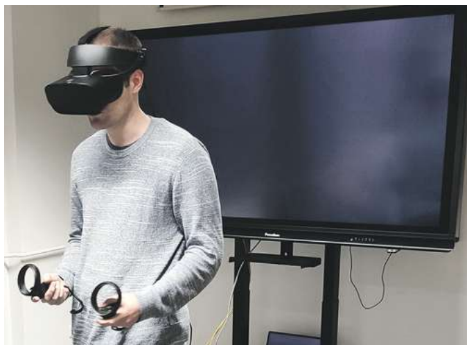
Mit einer VR-Brille kann die Welt in der Stadtbibliothek jetzt virtuell bereist werden.

Die Teilnahme an beiden Veranstaltungen ist kostenfrei und eine Anmeldung ist bei beiden Angeboten nicht erforderlich.