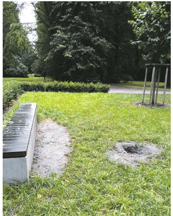
Die tiefen Löcher sind beim Betreten der Rasenflächen eine große Verletzungsgefahr.