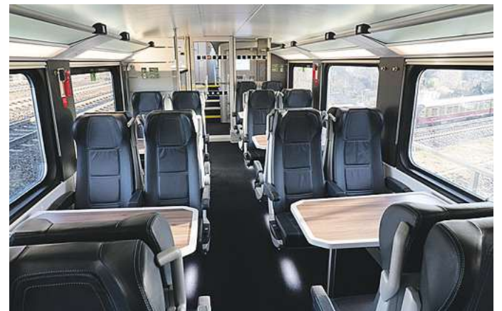
Ab 8. März sind dann die ersten acht Züge auf der neuen IC-Linie Rostock-Berlin-Dresden unterwegs.