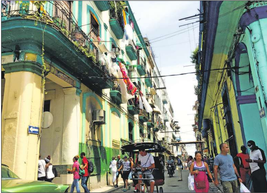
Centro Habana (Havanna-Mitte), 2016