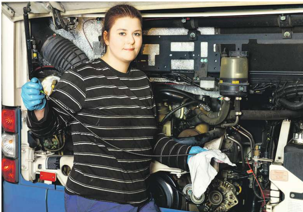
Frauen sind heute auch in „typischen Männerberufen“ sehr erfolgreich.