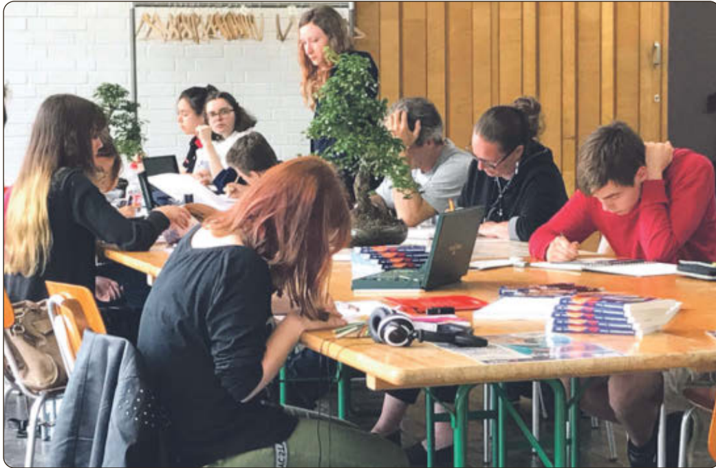
Manga/Comic-Zeichnkurs am 23.06.2017 im Rahmen der Bonsai-Tage in der Rostocker Kunsthalle