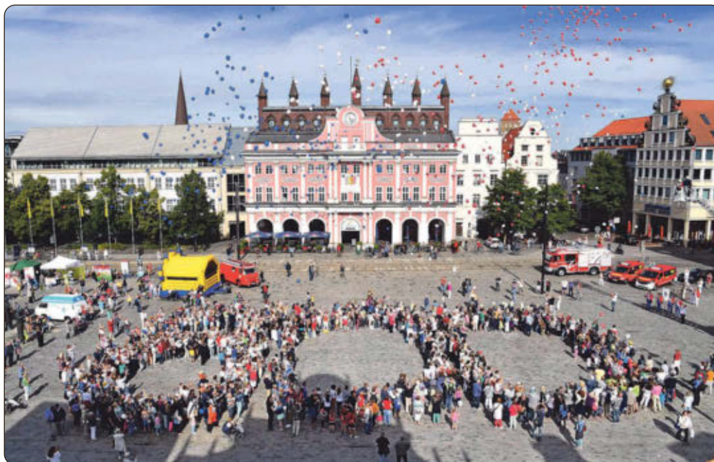
Die „800“ auf dem Neuen Markt stimmte kürzlich auf das Jubiläum ein.

Normal 8, Super 8 oder 16 mm vorliegen. Denn es ist noch gar nicht so lange her, da wurden bewegte Erinnerungen statt auf Video mit der Filmkamera auf Zelluloid festgehalten: Die Entwicklung der Kinder, die Hochzeit oder andere besondere Ereignisse. Oft war dabei auch die Stadt wichtige Kulisse solch privater Filme, die heute vielleicht in der Abstellkammer ihr Dasein fristen. Diese Filmsequenzen von Rostock sollen gerettet werden. Denn irgendwann trennt man sich vielleicht